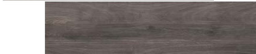
30x120 / 12"x48" RD SQ \varnothing 20 mm EVO_2/E™