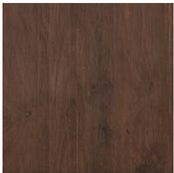
60x60 / 24"x24" RD SQ \varnothing 20 mm EVO_2/E™