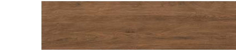
30x120 / 12"x48" RD SQ \varnothing 20 mm EVO_2/E™