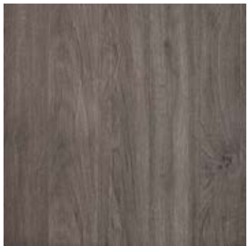
60x60 / 24"x24" RD SQ \varnothing 20 mm EVO_2/E™