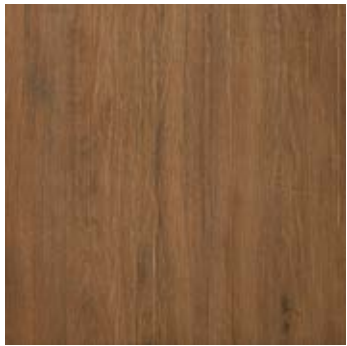
60x60 / 24"x24" RD SQ \varnothing 20 mm EVO_2/E™